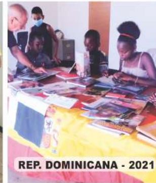
REP. DOMINICANA - 2021