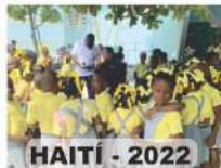
HAITI - 2022