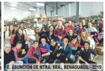
C. ASUNCIÓN DE NTRA. SRA., BENAGUACIL - 2019