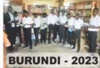
BURUNDI - 2023