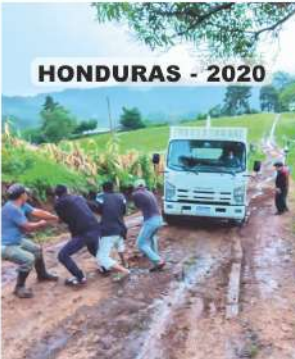
HONDURAS - 2020