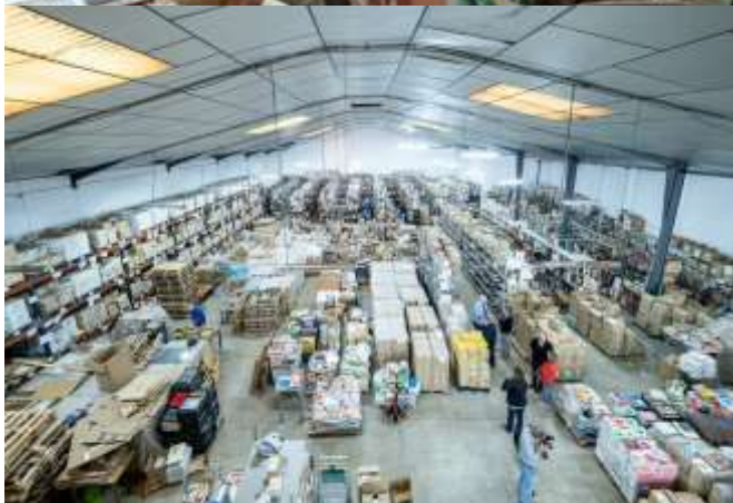
Nave Industrial de Alacuás

Email: bibliotecasolidariaalacuas@gmail.com