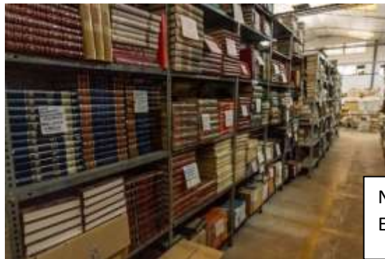
Nave Alacuás- Estanterías almacén

Nave, Oficina central de gestión, conectada informáticamente con nuestra sede en Valencia. Almacén General y clasificación de libros y material escolar. Confección y embalaje de los pedidos (que se preparan en ambas sedes) y expedición a través de las Navieras que lo recogen.