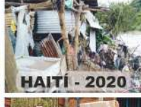
HAITI - 2020