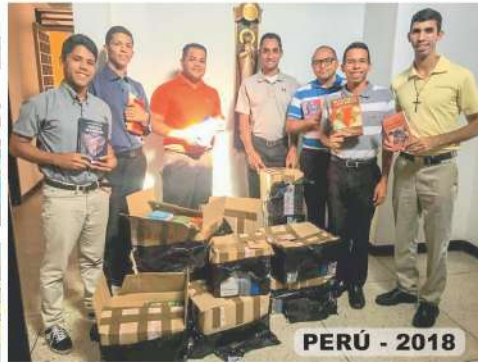
PERÚ - 2018