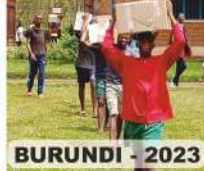
BURUNDI - 2023