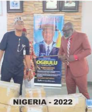
NIGERIA - 2022