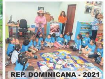
REP. DOMINICANA - 2021