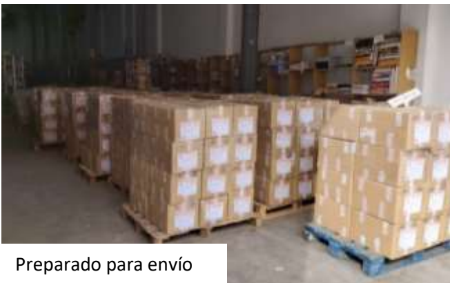
Preparado para envío

Nave, Oficina central de gestión, conectada informáticamente con nuestra sede en Valencia. Almacén General y clasificación de libros y material escolar. Confección y embalaje de los pedidos (que se preparan en ambas sedes) y expedición a través de las Navieras que lo recogen.