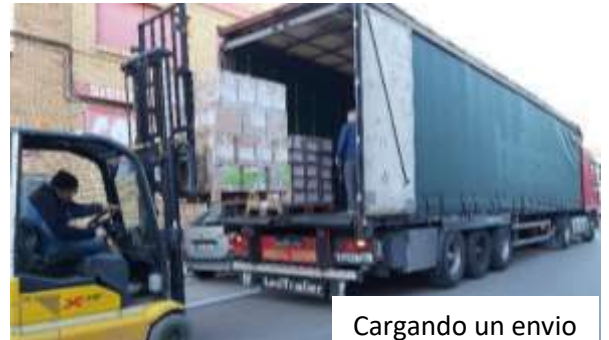
Cargando un envío

Puede entrar en nuestra página web www.padrejuan.org . Donde encontrará la información al día de todas nuestras actividades