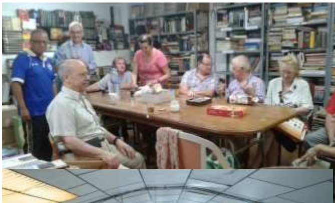
Grupo de voluntarios de Valencia