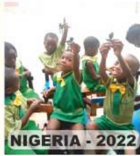
NIGERIA - 2022