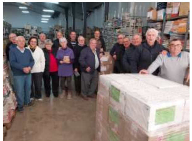
Grupo de voluntarios Alacuás