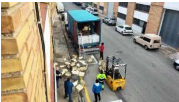
Cargando un contenedor destino Burundi

Los gastos se pagan mediante aportación de Donativos, con los beneficios de rastrillos, calendarios, recogida de tapones de plástico y reciclado de papel y cartón