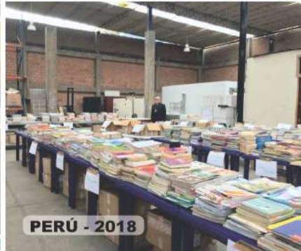
PERÚ - 2018