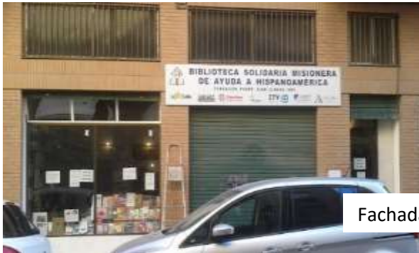
Fachada local C/. Industria

Situada en C/. Industria, 8 bajo, zona puerto de Valencia, local cedido GRATUITAMENTE por la empresa ALBA-MER Construcciones, S.L.-