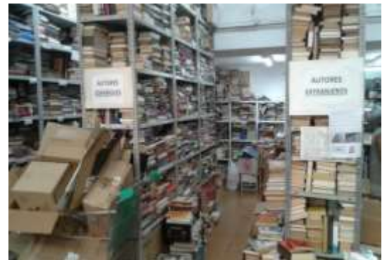
Local C/. Industria

Por otra parte, la Biblioteca Solidaria Misionera ofrece libros en préstamo a cambio de una aportación económica voluntaria. Además, se organizan rastrillos solidarios en diferentes puntos de Valencia y Provincia, donde nos ceden espacios para tal fin.