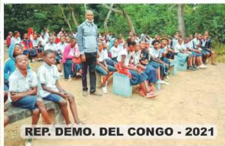
REP. DEMO. DEL CONGO - 2021