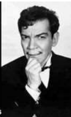
Mario Moreno Cantinflas

"Estamos viviendo un momento histórico en que el hombre científica e intelectualmente es un gigante, pero moralmente es un pigmeo"