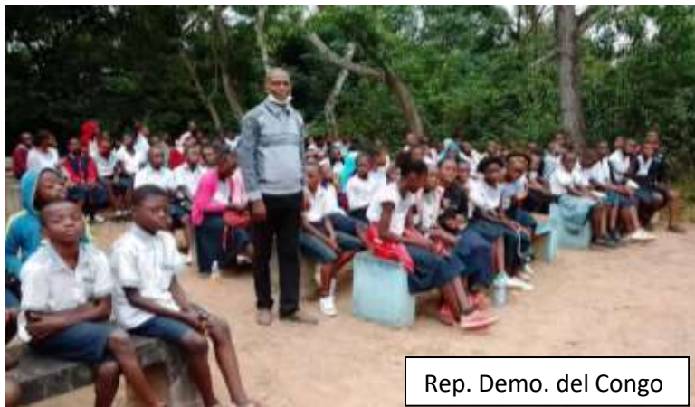
Rep. Demo. del Congo