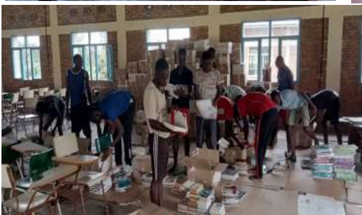
Clasificando y ordenando el envío recibido- Ruanda