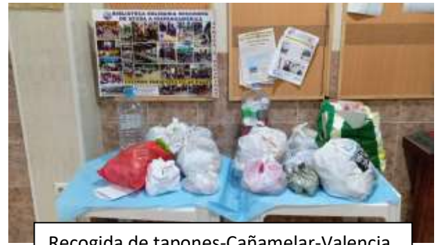
Recogida de tapones-Cañamellar-Valencia