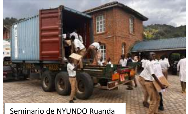
Seminario de NYUNDO Ruanda