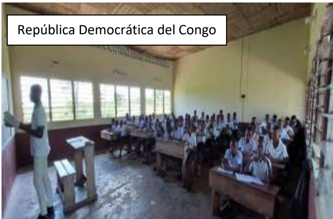
República Democrática del Congo

BIBLIOTECA SOLIDARIA MISIONERA DE AYUDA A HISPANOAMÉRICA FUNDACIÓN PADRE JUAN SCHENK (Valencia - España)