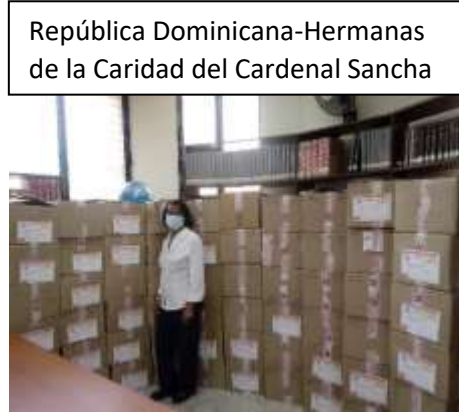
República Dominicana-Hermanas de la Caridad del Cardenal Sancha