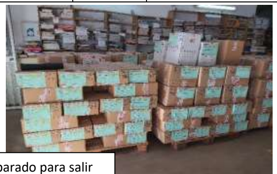
Envío a Perú preparado para salir

Nota: A todos estos pedidos además de libros y material escolar se les ha incluido mobiliario escolar (mesas y sillas de brazo).