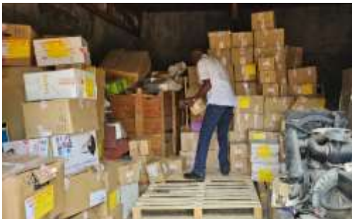
Rep. Demo. del Congo-material recibido

BIBLIOTECA SOLIDARIA MISIONERA DE AYUDA A HISPANOAMÉRICA FUNDACIÓN PADRE JUAN SCHENK (Valencia - España)