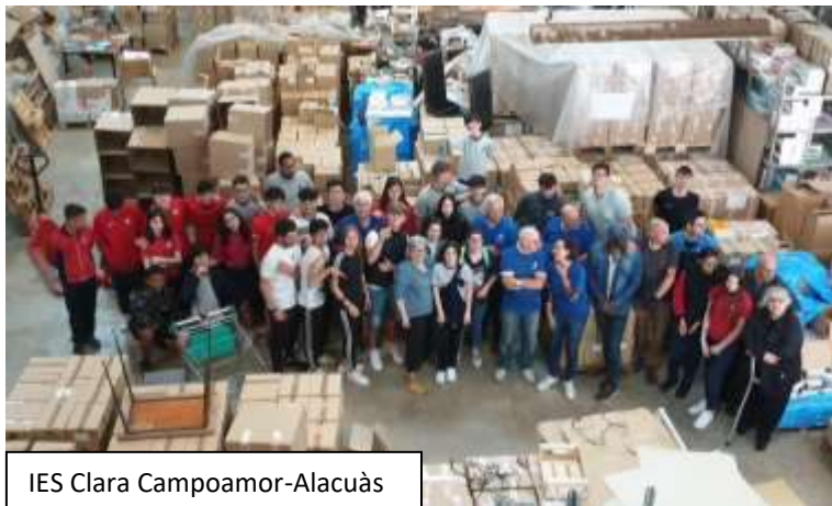
IES Clara Campoamor-Alacuàs