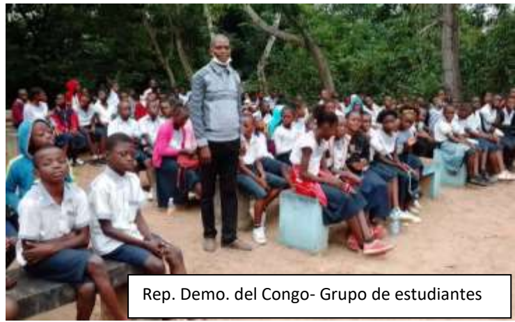
Rep. Demo. del Congo- Grupo de estudiantes