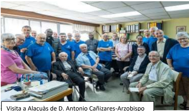
Visita a Alacuàs de D. Antonio Cañizares-Arzbispo