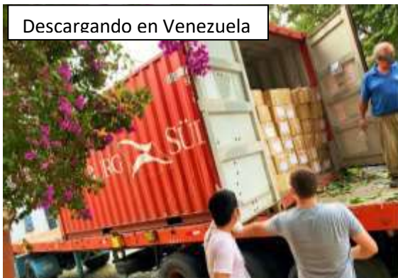
Descargando en Venezuela