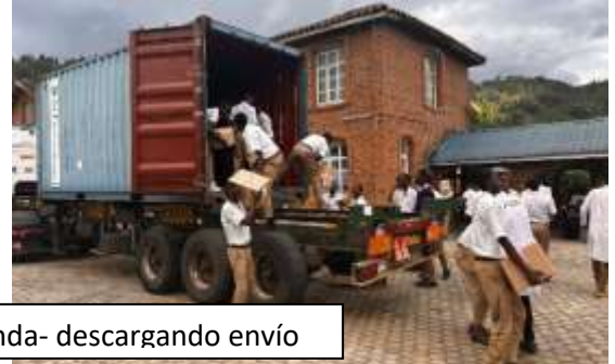
Nyundo-Ruanda- descargando envío