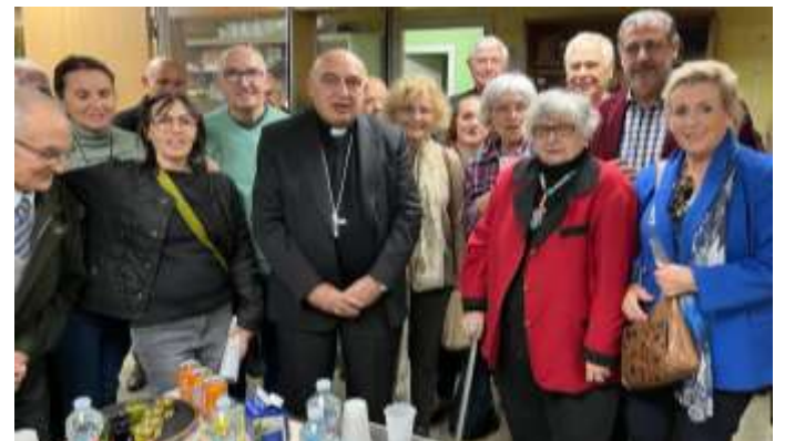
Visita a Alacuàs D. Enrique Benavent-Arzbispo