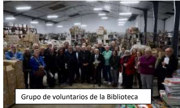
Grupo de voluntarios de la Biblioteca