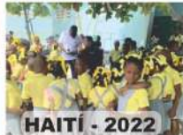
HAITI - 2022