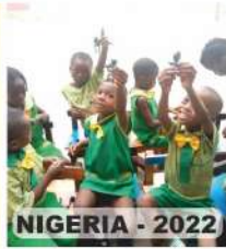
NIGERIA - 2022