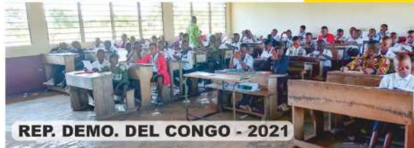
REP. DEMO. DEL CONGO - 2021