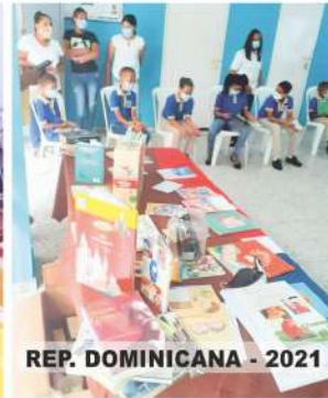
REP. DOMINICANA - 2021