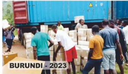
BURUNDI - 2023