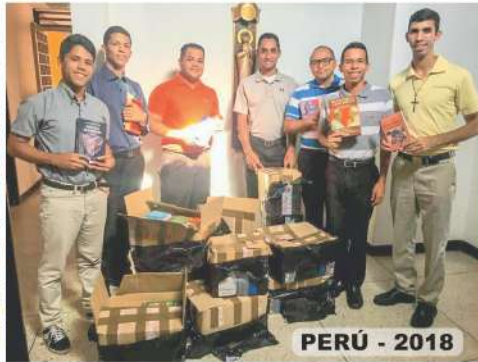
PERÚ - 2018