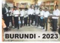
BURUNDI - 2023