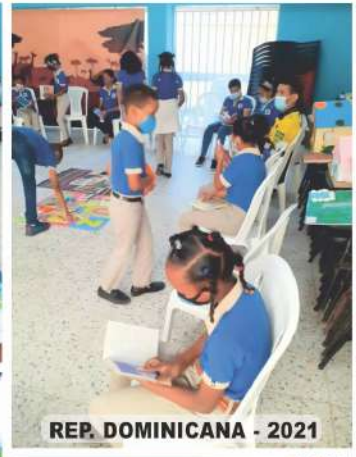
REP. DOMINICANA - 2021