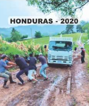
HONDURAS - 2020