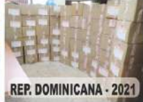
REP. DOMINICANA - 2021