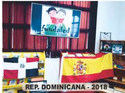
REP. DOMINICANA - 2018