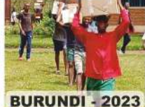
BURUNDI - 2023