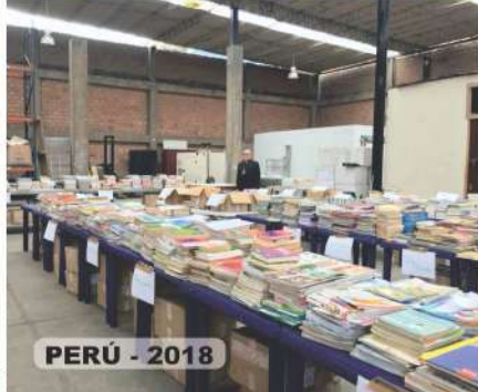
PERÚ - 2018