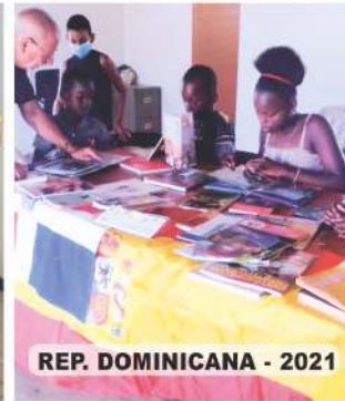
REP. DOMINICANA - 2021