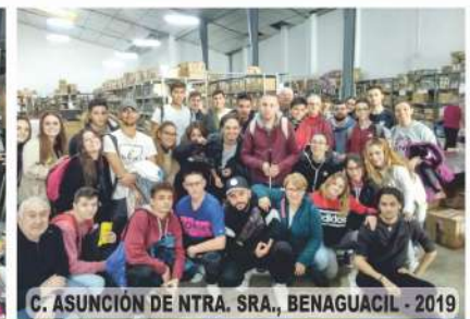
C. ASUNCIÓN DE NTRA. SRA., BENAGUACIL - 2019