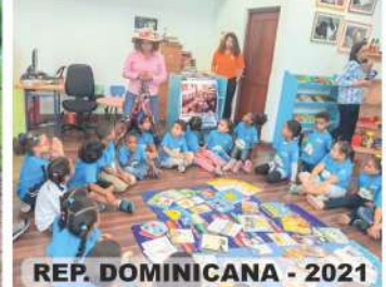
REP. DOMINICANA - 2021