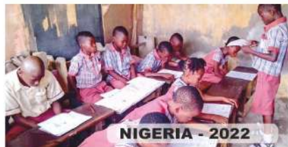
NIGERIA - 2022