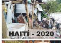
HAITI - 2020