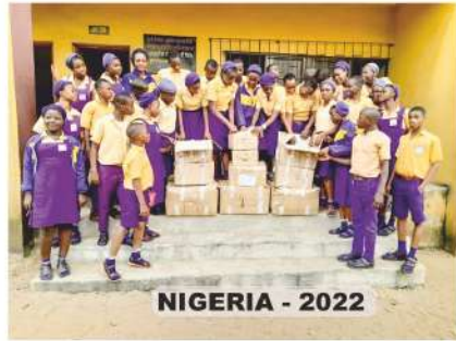
NIGERIA - 2022