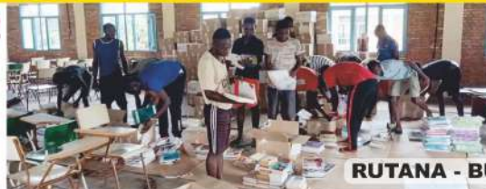
RUTANA - BURUNDI - 2023