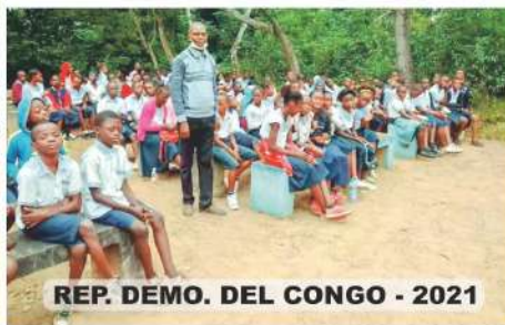
REP. DEMO. DEL CONGO - 2021