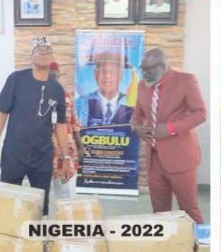
NIGERIA - 2022