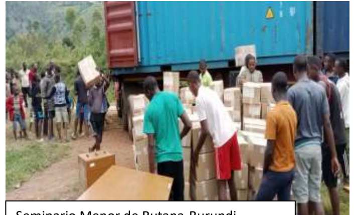
Seminario Menor de Rutana-Burundi

Estamos aquí para empezar como siempre con gran ilusión y fuerza. El año que finaliza ha terminado, con un gran esfuerzo de todo este grupo de VOLUNTARIOS que formamos el activo de nuestro proyecto. Se han alcanzado los objetivos que nos habíamos marcado, alcanzar la cifra de UN MILLON de libros enviados a 29 países , y no solo es eso, es que gracias a las aportaciones de libros, material escolar, mobiliario escolar y las aportaciones económicas de todos los que habéis colaborado, hemos conseguido llegar a la meta.