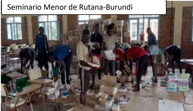
Seminario Menor de Rutana-Burundi

Empezamos nueva andadura, hacia los DOS MILLONES. Muchos son los pedidos a servir y las necesidades de todos aquellos que por un sinfín de circunstancias no cuentan con ninguna posibilidad de adquirir una mínima formación (económica, social, de medios, política, etc...), en este punto nos encontramos en Biblioteca Solidaria Misionera, para ayudar a todos los que lo necesiten y lo soliciten. Nuestro “caballo de batalla” es la economía, pues los costes de envíos se han disparado y necesitamos cumplir