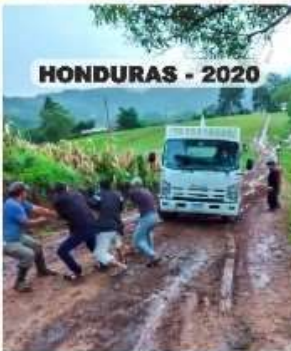
HONDURAS - 2020