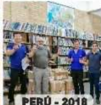
PERÚ - 2018