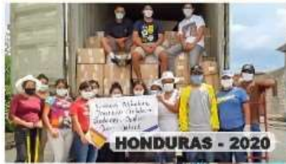
HONDURAS - 2020