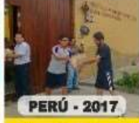
PERÚ - 2017