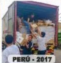
PERÚ - 2017