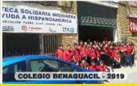
COLEGIO BENAGUACIL - 2019