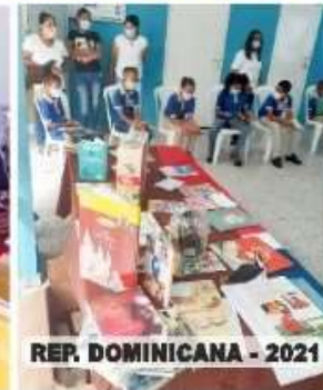
REP. DOMINICANA - 2021