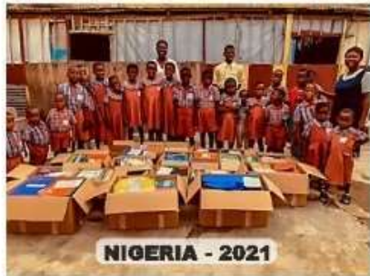
NIGERIA - 2021