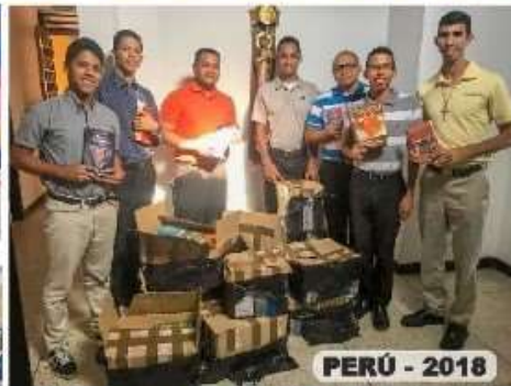
PERÚ - 2018