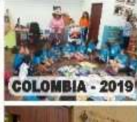
COLOMBIA - 2019