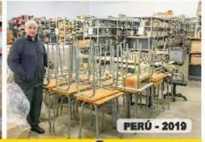
PERÚ - 2019