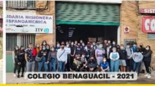
COLEGIO BENAGUACIL - 2021