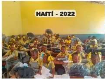
HAITÍ - 2022