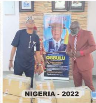
NIGERIA - 2022