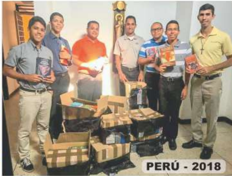
PERÚ - 2018