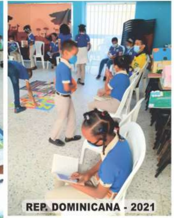
REP. DOMINICANA - 2021