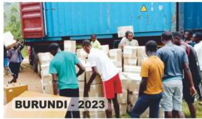
BURUNDI - 2023