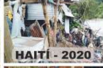
HAITI - 2020