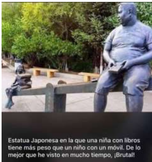
Estatua Japonesa en la que una niña con libros tiene más peso que un niño con un móvil. De lo mejor que he visto en mucho tiempo, ¡Brutal!

Un libro abierto es un cerebro que habla; cerrado un amigo que espera; olvidado, un alma que perdona; destruido, un corazón que llora.