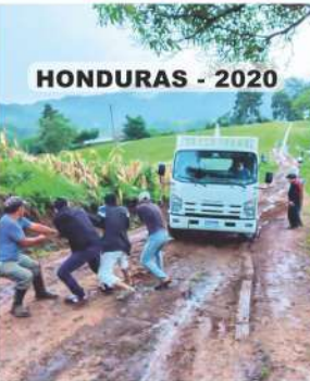
HONDURAS - 2020