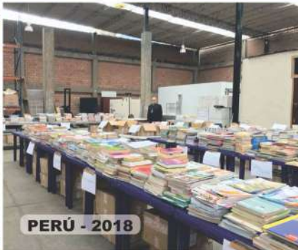
PERÚ - 2018