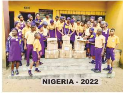
NIGERIA - 2022