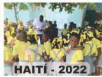
HAITI - 2022