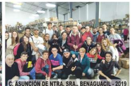
C. ASUNCIÓN DE NTRA. SRA., BENAGUACIL - 2019