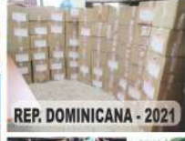
REP. DOMINICANA - 2021