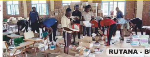
RUTANA - BURUNDI - 2023