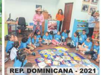
REP. DOMINICANA - 2021