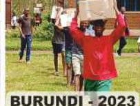
BURUNDI - 2023