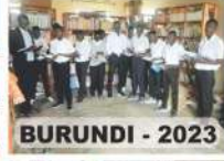
BURUNDI - 2023