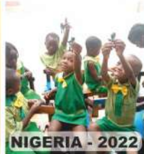
NIGERIA - 2022