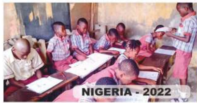
NIGERIA - 2022