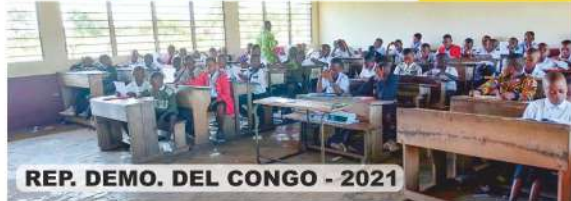
REP. DEMO. DEL CONGO - 2021