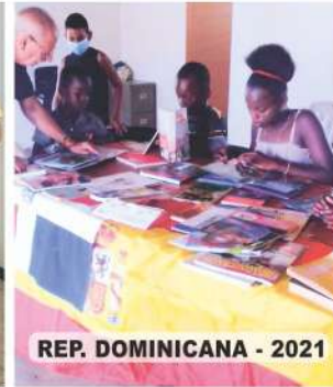
REP. DOMINICANA - 2021