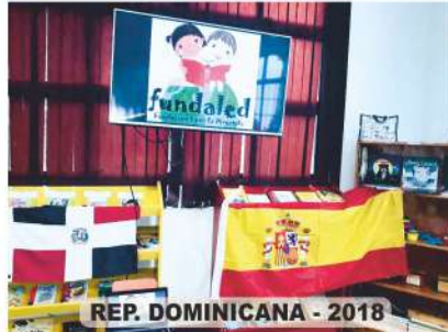
REP. DOMINICANA - 2018