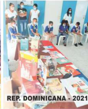
REP. DOMINICANA - 2021