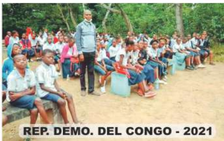
REP. DEMO. DEL CONGO - 2021