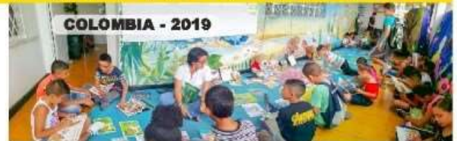
COLOMBIA - 2019