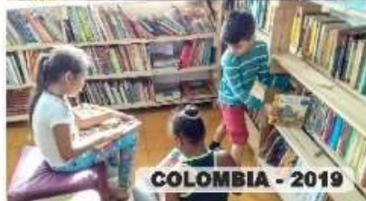
COLOMBIA - 2019