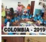
COLOMBIA - 2019