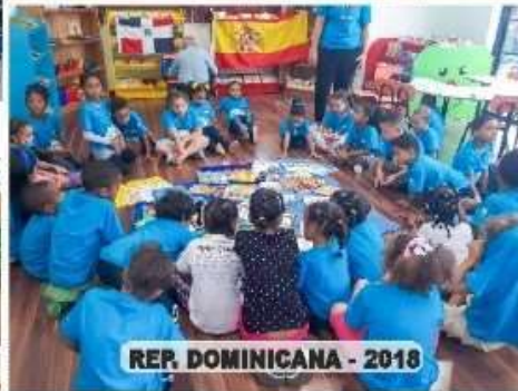
REP. DOMINICANA - 2018