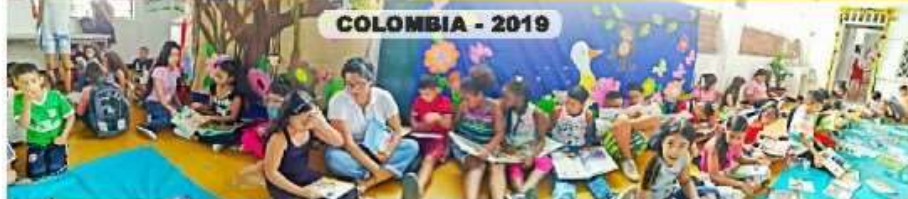
COLOMBIA - 2019