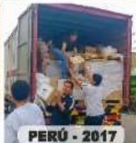
PERÚ - 2017