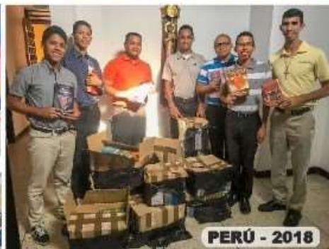
PERÚ - 2018