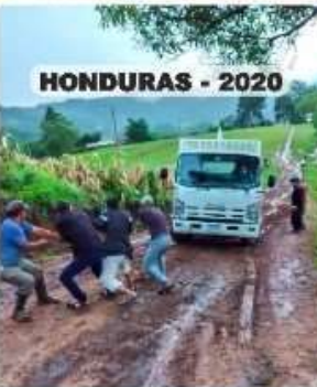
HONDURAS - 2020