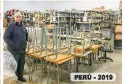
PERÚ - 2019