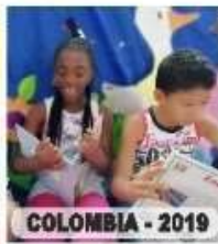
COLOMBIA - 2019