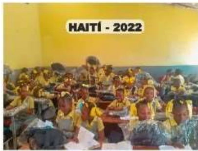
HAITÍ - 2022