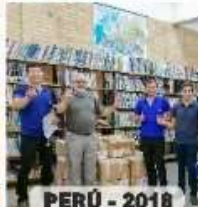
PERÚ - 2018