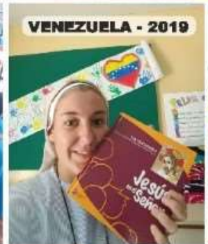
VENEZUELA - 2019