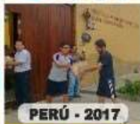
PERÚ - 2017