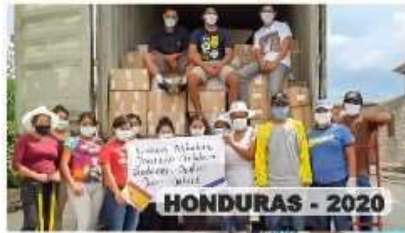
HONDURAS - 2020