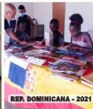
REP. DOMINICANA - 2021