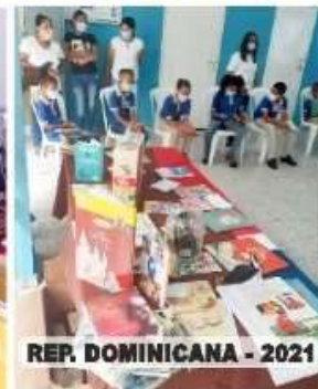
REP. DOMINICANA - 2021