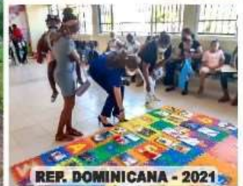
REP. DOMINICANA - 2021