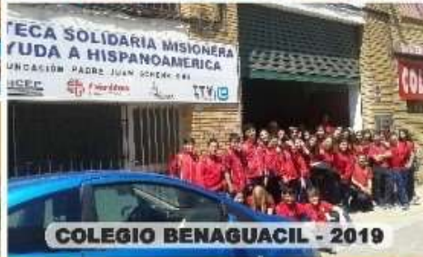
COLEGIO BENAGUACIL - 2019