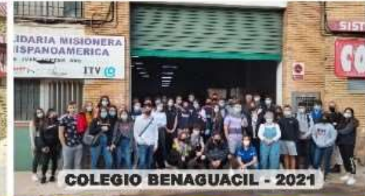
COLEGIO BENAGUACIL - 2021