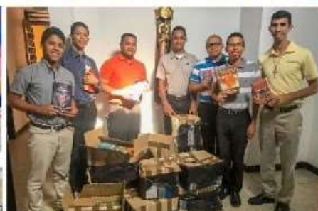
PERÚ - 2018