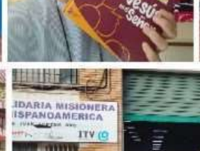
COLEGIO BENAGUACIL - 2021