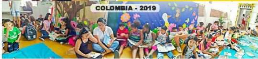
COLOMBIA - 2019