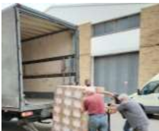
Cargando con destino a Palo Rosa envío Haití