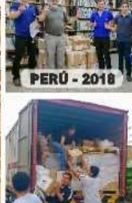
PERÚ - 2018