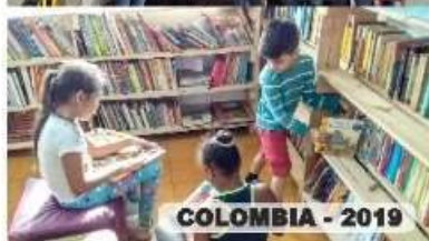
COLOMBIA - 2019