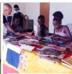
REP. DOMINICANA - 2021