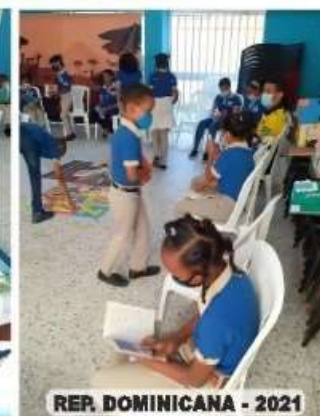
REP. DOMINICANA - 2021