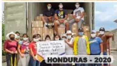
HONDURAS - 2020