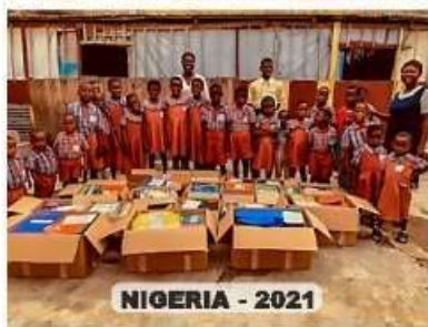
NIGERIA - 2021