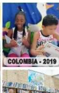
COLOMBIA - 2019