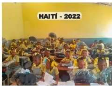
HAITÍ - 2022