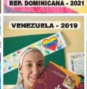
VENEZUELA - 2019