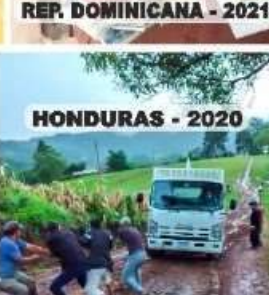
HONDURAS - 2020