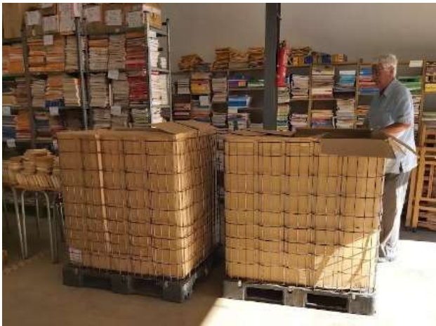
Libros recibidos desde Cherburgo-Normandía en junio 2022- cuatro contenedores

El envío con destino a INSTITUTION MIXTE LE BON SAMARITAIN DE VARREUX , HAITÍ, ha llegado a su destino. Estos libros en FRANCÉS han sido gestionados y aportados con la colaboración de Rotary E-Club Puerto Rico & Las Américas y Club Rotary de Cherburgo- Normandía . En el mes de Junio recibimos un total de 1.900 Kg. en cuatro palets, procedentes de Cherburgo-Normandía (Francia). Y la Biblioteca Solidária Misionera ha aportado además a este envío 952 Kg.