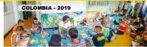
COLOMBIA - 2019