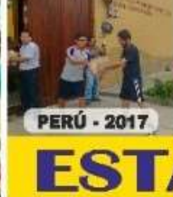
PERÚ - 2017