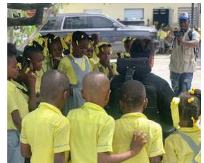
INSTITUTION MIXTE LE BON SAMARITAIN DE VARREUX , HAITÍ,

Estamos preparando nuevos envíos en francés para Haití, Burundi y República Democrática del Congo; para lo cual seguimos