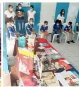
REP. DOMINICANA - 2021