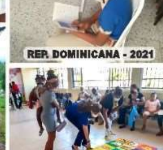
REP. DOMINICANA - 2021